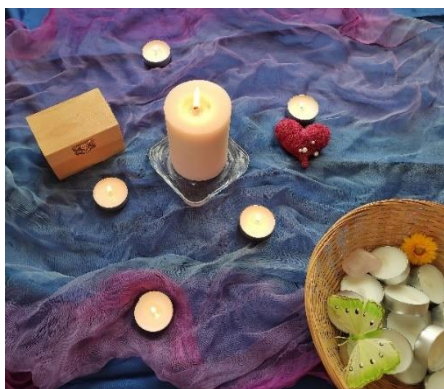
Übung: Schön, dass du da bist!