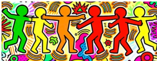
Vielfalt und Sinnbildung.