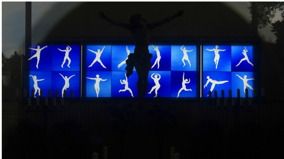
„Tanzender Christus“, Josef Fink, Aufbahngshalle des Friedhofes von St. Veit in Graz.