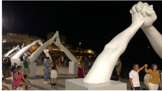
Zueinander Brücken bauen.