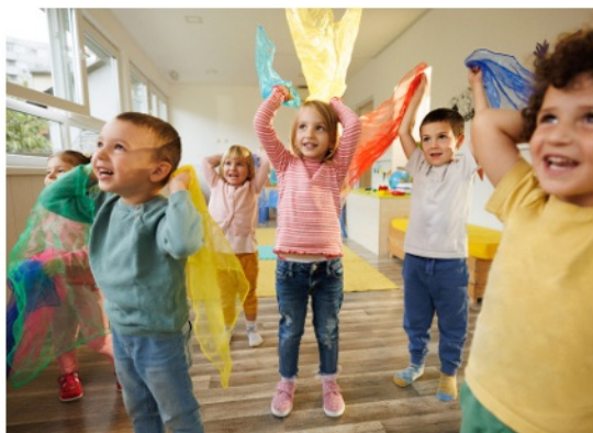
Freude an der Bewegung.