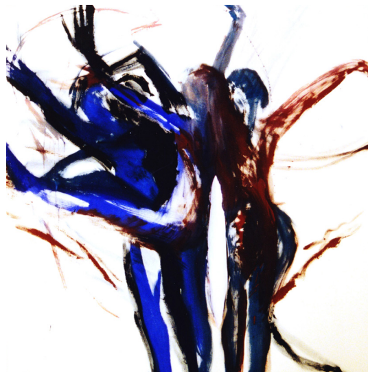
Blauer Tanz, 1994.

K örperliches Werden – „bodily becoming“ (vgl. LaMothe) – ist ein Prozess, der Zeit braucht. Angefangen von der Entwicklung der befruchteten Eizelle hin zum Embryo (vgl. Bainbridge-Cohen 1993, 63-65 und Sieben 2008, 96), über körperliches Werden in der Kindheit und Jugend, das sich im Erwachsenenalter fortsetzt, sind Bewegungen und Gesten für körperliches Werden.